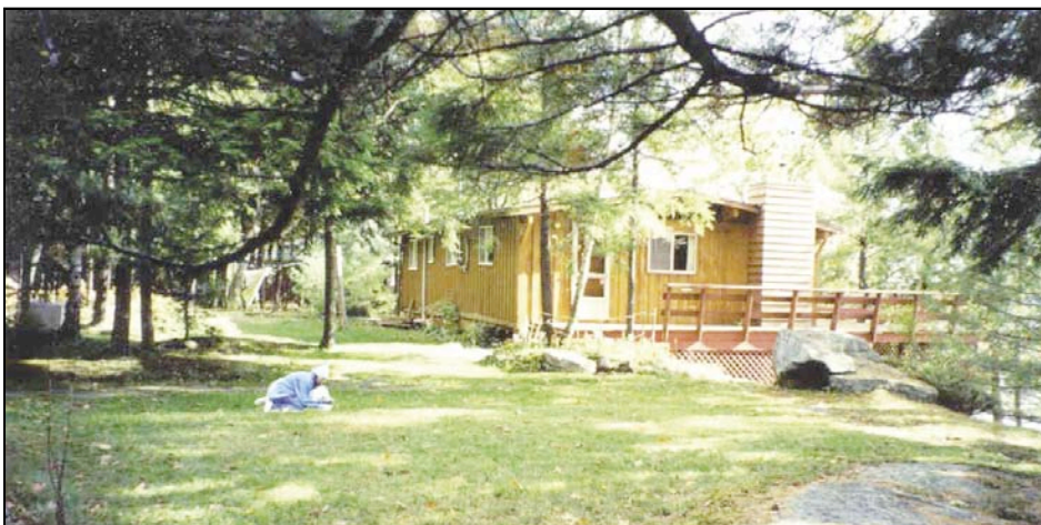
Figure 2 Cette pelouse à faible entretien n'est tondue que deux ou trois fois par année et ne nécessite aucun autre entretien. Elle est constituée de trèfle rampant et d'herbes à gazon.

Pour créer et entretenir une pelouse à faible entretien, il faut suivre trois étapes : choisir un mélange d'espèces approprié, procéder à la mise en place et changer ses habitudes d'entretien.