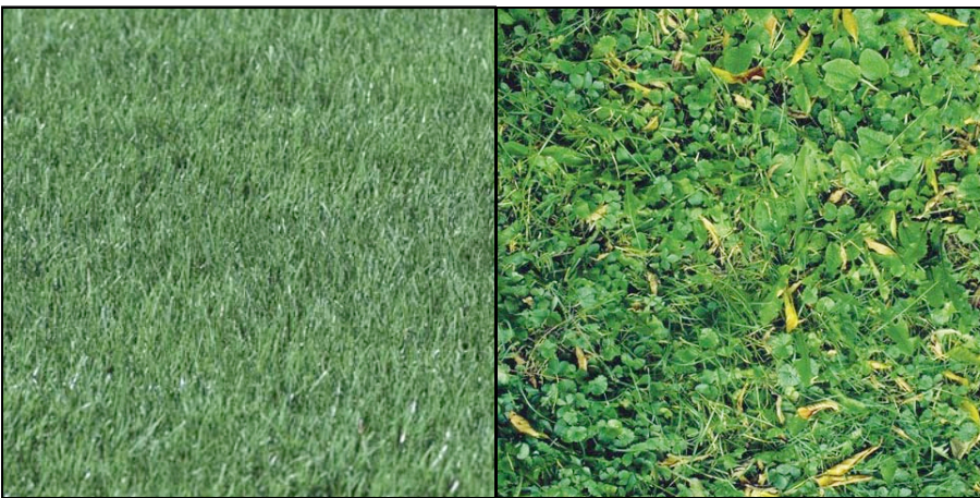
Figure 1 Vue rapprochée d'une pelouse traditionnelle (gauche) et d'une pelouse à faible entretien (droite)