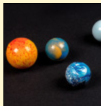
Les chocolats COSMOS