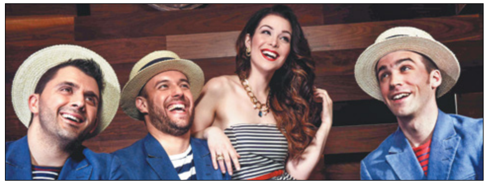
Durant le Festival DécouvrArts, le quatuor The Lost Fingers sera de la partie le 1 er juin.

Jean Ravel en formule quintette sera de la partie le 2 juin à compter de 20 h également. Après avoir conquis les juges de La Voix en 2013, Jean Ravel propose un spectacle acoustique en toute simplicité, regroupant