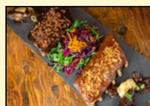
Le plateau BBQ du Côtes-à-Côtes Resto-Grill