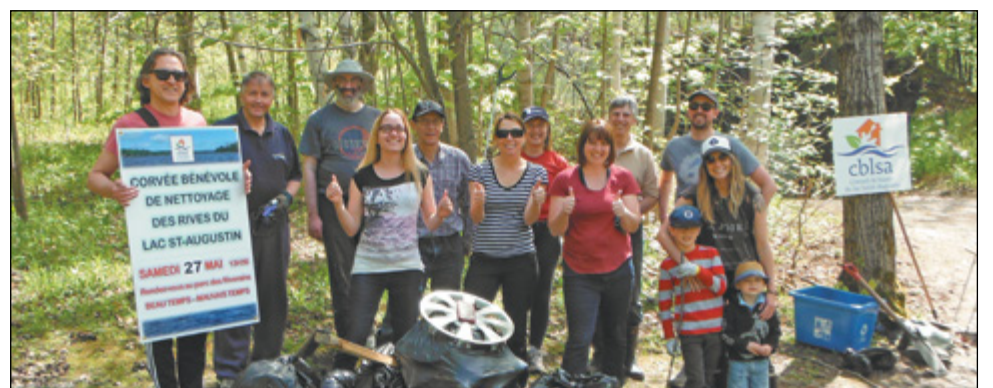
Les bénévoles de la corvée 2017 de nettoyage des rives du lac Saint-Augustin.

Les gants et les sacs de plastique sont fournis en plus de bénévoles pour répondre à vos questions concernant le lac Saint-Augustin. Apportez vos pelles ou vos pinces, vos bras et votre bonne humeur contagieuse! ■