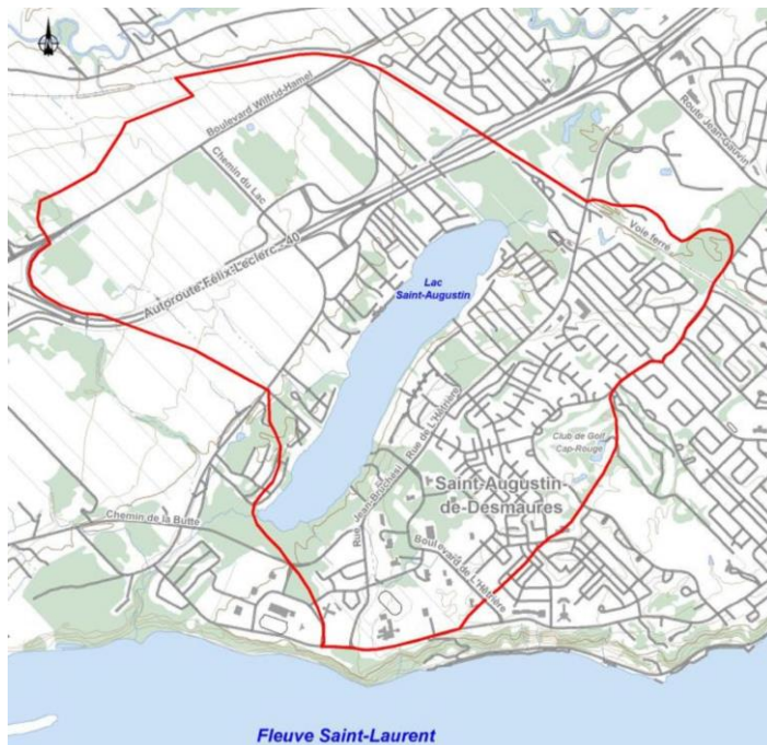
Figure 1 : Bassin versant du lac Saint-Augustin et niveau d'urbanisation actuel 14